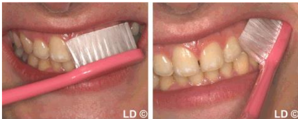
Brossage des faces extérieures des dents