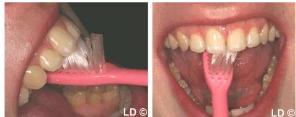
brossage des faces internes des dents (en plaçant la brosse verticalement)